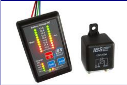
IBS-DBS Doppelbatteriesystem mit uProzessor und Relais 200A

Kabel blau +Batterie (Aux) Kabel grün Steuerspule (ER2)