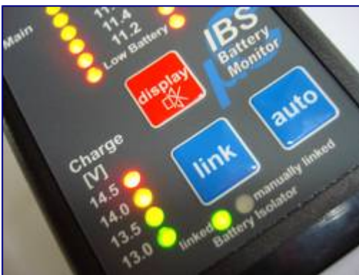
Detail Monitor IBS-DBS