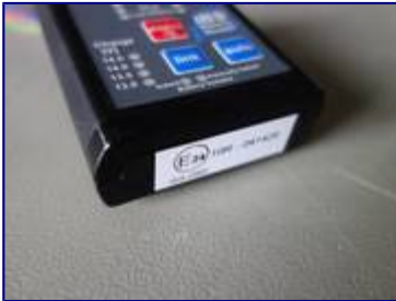
E-Mark-Kleber auf Gehäuse